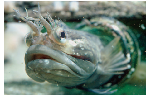
TUBÍCOLA MANCHA SINGULAR