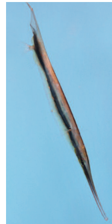
PEZ PIPA CAMARÓN